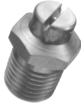
AZ HARDENED STAINLESS STEEL