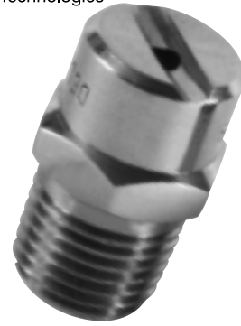
AZ STAINLESS STEEL